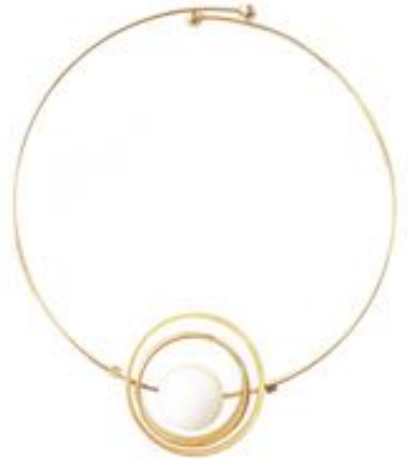
歌手 VAVA 佩戴 WJY STUDIO 2018 宇宙星座系列 天然宝石 18K 镀金宇宙星系守护手环 出席活动发布会