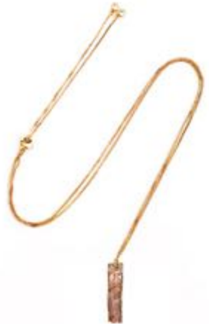
歌手苏诗丁佩戴 WJY STUDIO 2018 天然肌理系列 天然玛瑙 18K 镀金不规则几何项链 出席活动街拍拍摄