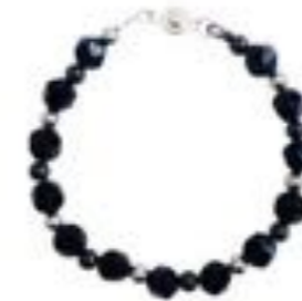
GM-40-23 几何记忆 铂金多面切割黑曜石手链 产品材质: 黑曜石 / 18K白金 产品尺寸: 手链: 20-23cm