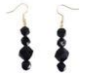
GM-40-19 几何记忆 铂金多面切割黑曜石耳坠 产品材质: 黑曜石 / 18K白金 产品尺寸: 耳坠: 3.5cm