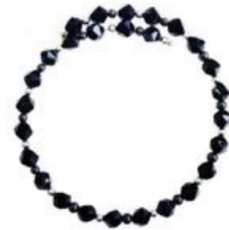
GM-40-24 几何记忆 铂金多面切割黑曜石项链 产品材质: 黑曜石 / 18K白金 产品尺寸: 项链: 30-45cm